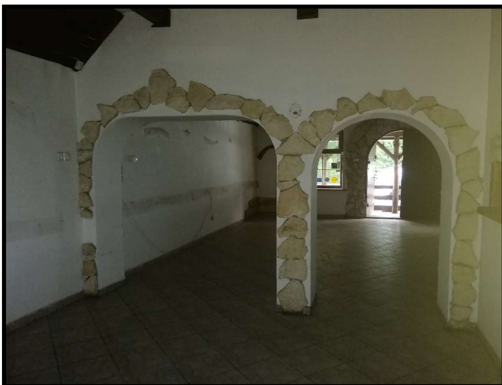
Fot. nr 5