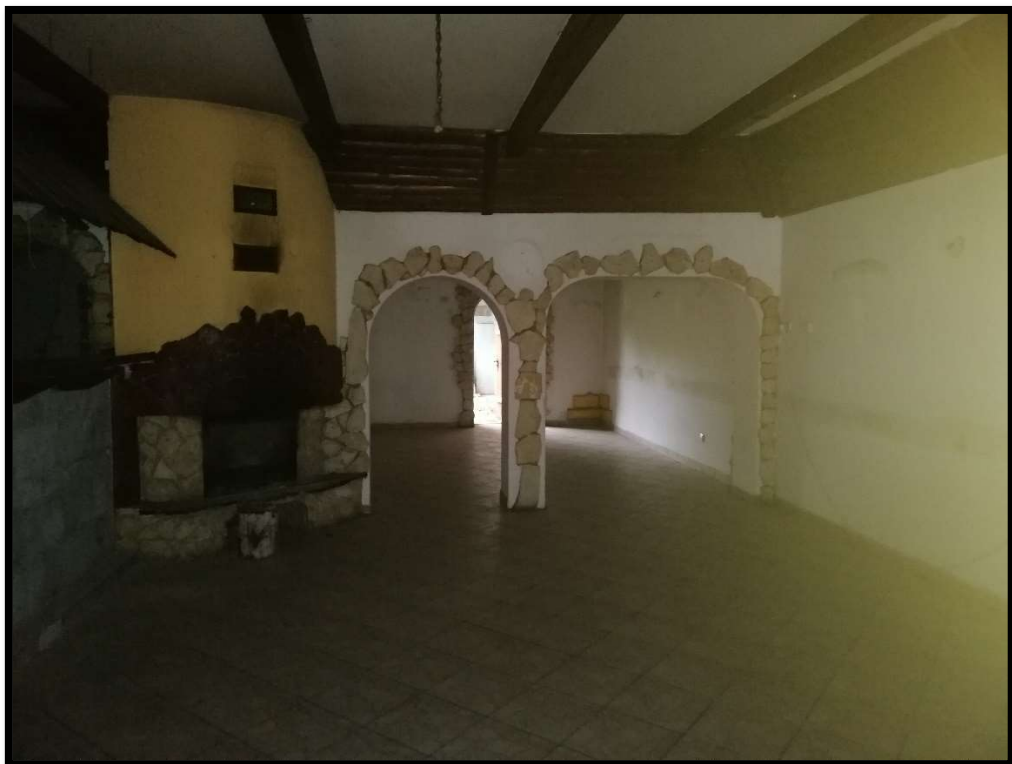
Fot. nr 4