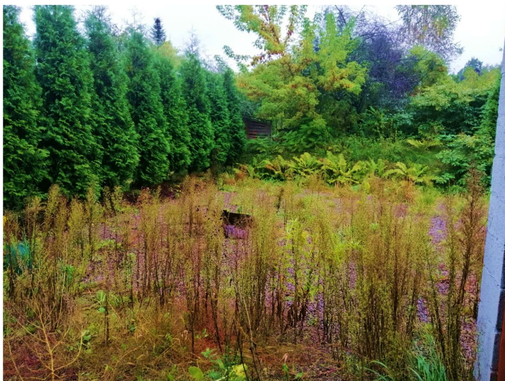
Fot. nr 8