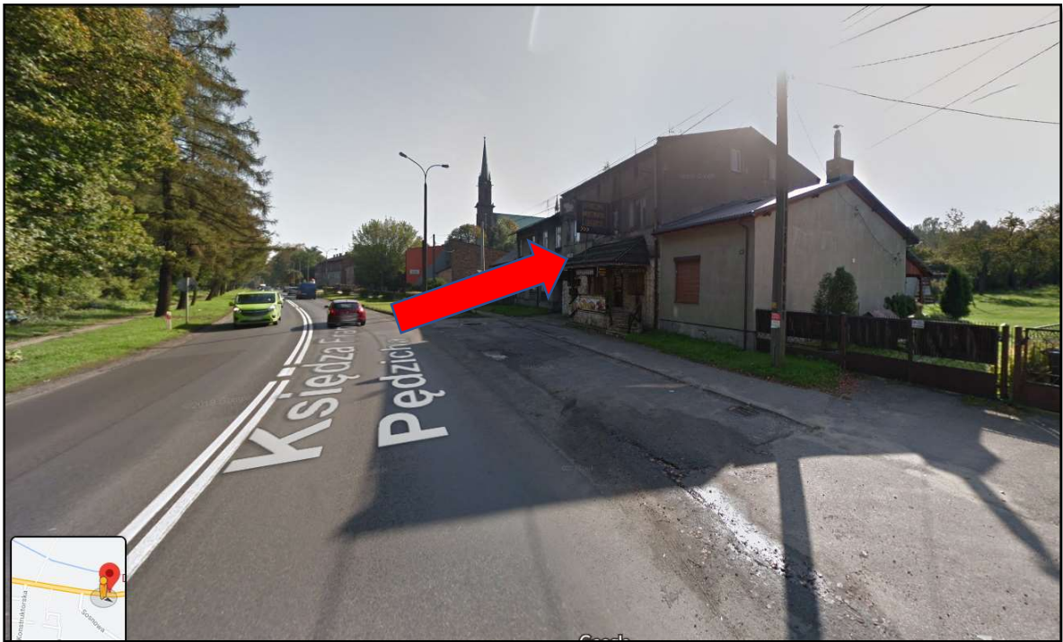
Fot. nr 1