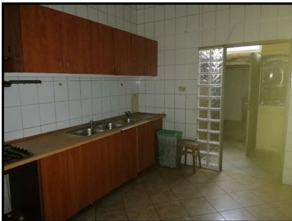
Fot. nr 6