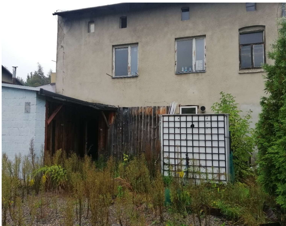
Fot. nr 7