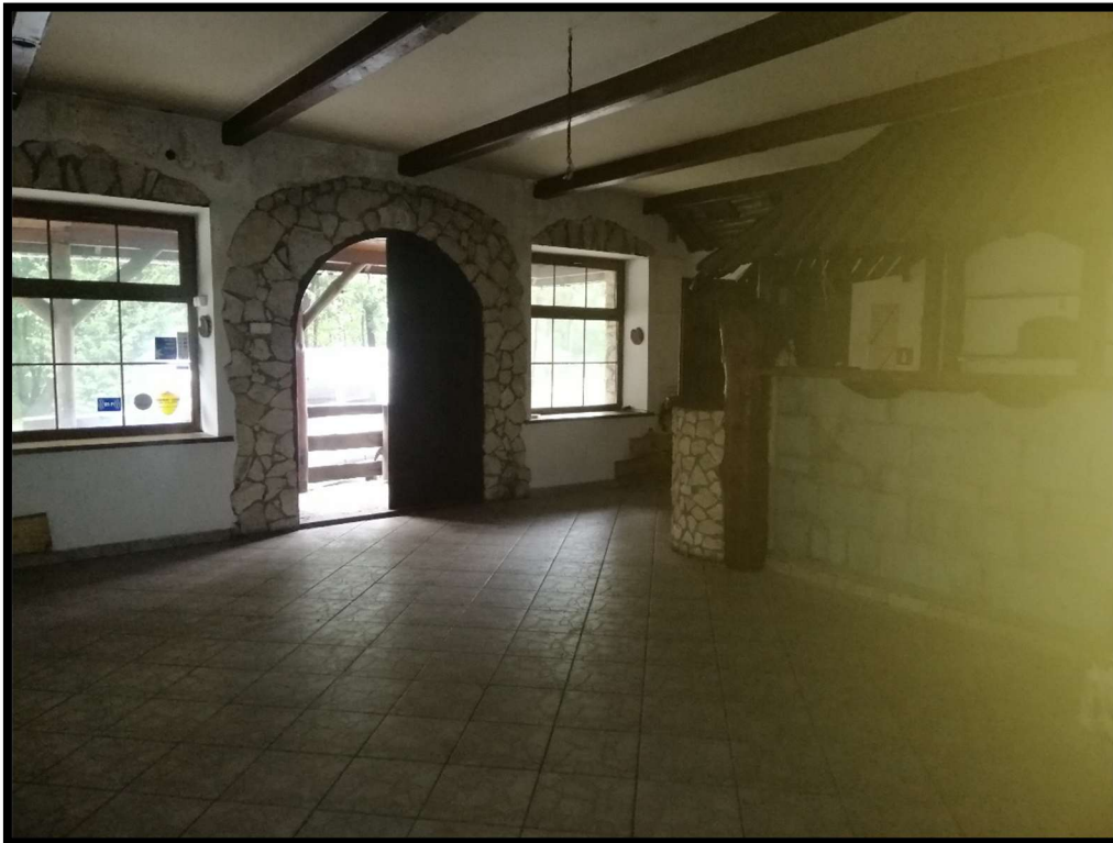
Fot. nr 3