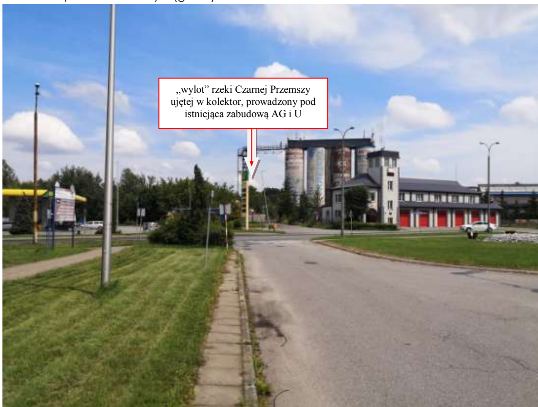
Fot. 4. Istniejące tereny obsługi samochodowej, tereny usługowe, tereny aktywności gospodarczej w obrębie korytarza M12 „Przemsza”.