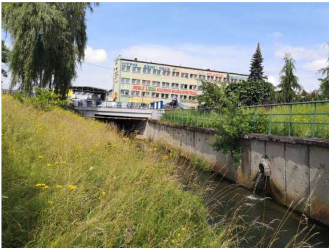
Fot. 2. Korytarz spójności obszarów chronionych M12 „Przemsza” – centrum Poręby. Istniejące tereny zabudowy aktywności gospodarczej (zabudowa dawnego zakładu przemysłowego FUM Poręba).