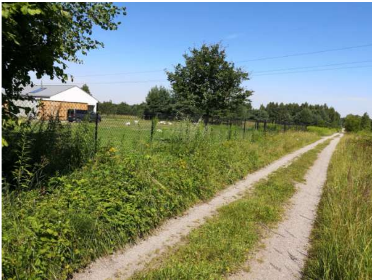
Fot. 1. Przykład rozpraszania zabudowy. Nowa zabudowa mieszkaniowa zlokalizowana na terenach łąk wilgotnych i świeżych.

projektu Studium nie wpłynie negatywnie na tendencje zmian w środowisku. Zaniechanie opracowania miejscowych planów zagospodarowania przestrzennego zgodnych z ustaleniami studium dotyczącymi zasad ochrony środowiska i jego zasobów, ochrony przyrody i krajobrazu kulturowego może mieć dla środowiska negatywne skutki. W przypadku braku realizacji ustaleń projektu Studium, zostanie także ograniczona możliwość rozwoju i aktywizacji terenów miasta Poręba.