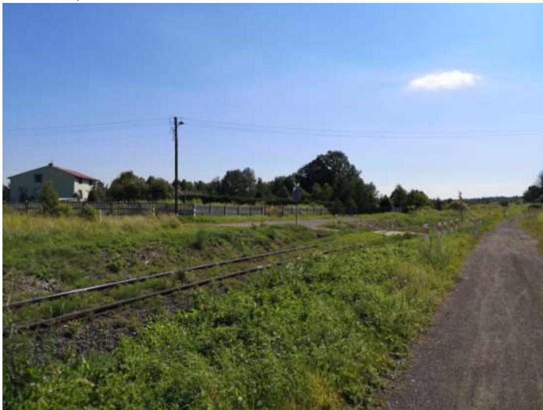
Fot. 6. Nowa zabudowa na terenach przeznaczonych pod zabudowę MU oraz istniejąca bariera „linia kolejowa”.